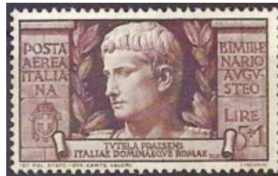
L'empereur Auguste sur un timbre Italien

Cette exposition est consacrée à Auguste, fils adoptif de Jules César, qui régna en maître sur l'Empire romain pendant plus de quarante ans.