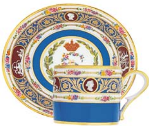
Service Catherine II de Russie

En janvier 2010, la Manufacture nationale de Sèvres et le Musée national de la céramique ont été réunis et rejoints par le Musée national Adrien Dubouché de Limoges ; il devient la Cité de la céramique - Sèvres & Limoges.