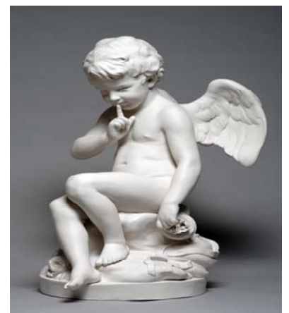
E.M. Falconet L'Amour menaçant

La Cité de la Céramique développe la création et la production de porcelaine mais a aussi une politique patrimoniale et de recherche scientifique.