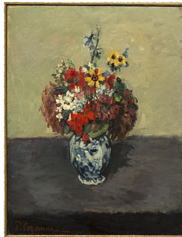
Paul Cézanne les géraniums