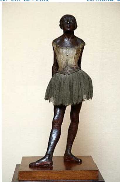
Edgar Degas La Petite danseuse de 14 ans

L'accrochage, chronologique, commence par des paysages de J-B-C Corot, Johan Barthold Jongkind et E. Boudin, dont, de ce dernier, la Plage de Bénerville , format hors du commun. Le Bar aux Folies Bergères d'E. Manet et Terrasse à Méric de F. Bazille conclue la première partie. Chaque artiste est représenté à travers une dizaine de toiles couvrant sa carrière. Sur les planches de Trouville , Hôtel des Roches Noires de Monet...en passant par une jeune inconnue portraiturée par B. Morisot en 1871, une Meule de C. Pissarro...sont des exemples des années 1870. Le tournant Loing à Moret d'A. Sisley (1886), les Jeunes filles au bord de la mer d'A. Renoir (vers 1890),...sont en revanche des travaux typiques du XIXème siècle. A côtés de ces toiles, l'exposition dévoile deux exceptionnelles sculptures, la Petite danseuse de 14ans par Degas et le Penseur , en terre cuite, d'Auguste Rodin.