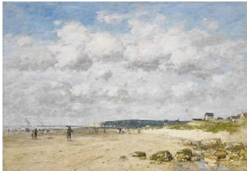
Eugène BOUDIN Bénerville plage

LE 11 MARS Célébrons ensemble cet anniversaire