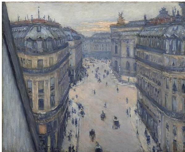
Gustave Caillebotte Rue Halévy

Cinquante prêteurs se sont associés avec enthousiasme à ce projet et ont accordé des prêts en provenance de France, des États Unis, du Mexique, de Suisse, de Grande-Bretagne et d'Italie. Quarante-peintures et une vingtaine d'œuvres graphiques par Jean-Baptiste-Camille Corot, Eugène Boudin, Johan Barthold Jongkind, Édouard Manet, Frédéric Bazi, Claude Monet, Pierre-Auguste Renoir, Edgar Degas, Camille Pissarro, Alfred Sisley, Gustave Caillebotte, Berthe Morisot, Arma Guillaumin, Paul Cézanne, Mary Cassatt, Eva Gonzalès et Auguste Rodin, permettent de retracer une histoire de l'impressionnisme à travers des œuvres inédites.