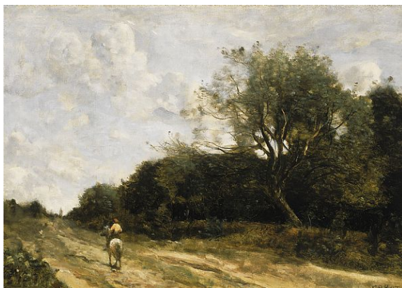
Camille COROT Le cavalier sur la route

L'exposition présente d'abord les prémices de ce mouvement. Elle continue avec son éclosion vers 1874, puis les années 1880-1890, quand le groupe se disloque pour laisser place au génie créatif de chacun. Enfin l'œuvre ultime de maîtres tels Renoir, Pissarro, Sisley et Monet, ouvre une fenêtre sur l'art moderne et clôt la manifestation.