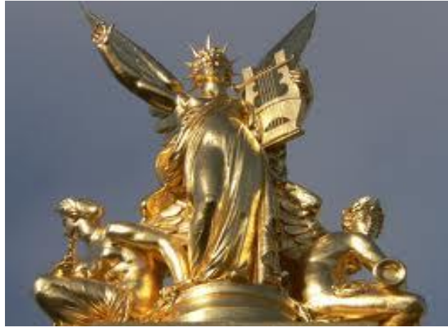
La Poésie par Charles Gumery

Ce palais fut bâti au 19 ème siècle (1861/1875) par Charles Garnier au centre d'un nouveau quartier, emblématique du Paris moderne voulu par l'empereur Napoléon III et son fidèle Haussmann. Sa devise lors de la remise de son projet : « J'aspire à beaucoup, j'attends peu »