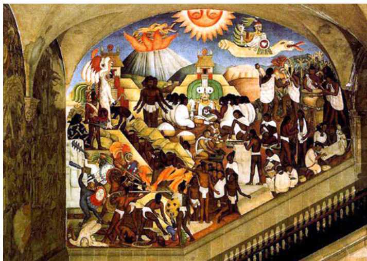
« Histoire du Mexique, de la Conquête à 1930 » Palais présidentiel de Mexico

Tarif : 10€(adhérent), 16€(non adhérent), gratuit carte Blanche Orsay ( chèque de caution de 10€/ personne)