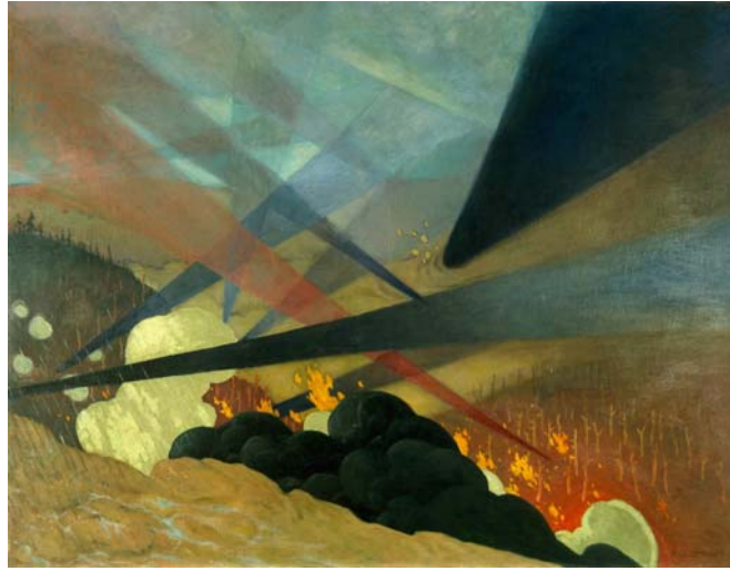
Verdun. Tableau de guerre interprété, projections colorées noires, bleues et rouges, terrains dévastés, nuées de gaz.

Jeudi 14 Novembre : RDV à 13h50 dans la file réservée au groupe, galeries du Grand Palais