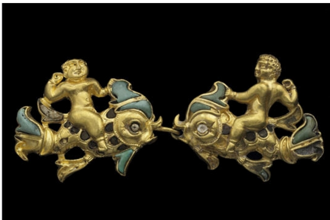
Agrafes représentant un amour sur un dauphin (Tillia Tepe, tombe II, Ier siècle, or)