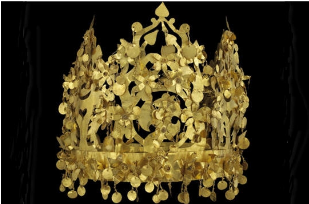
Couronne (Tillia Tepe, tombe V, 1er siècle, or)