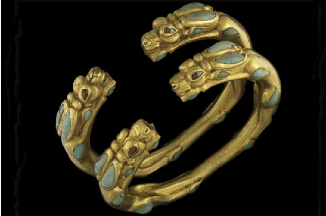
Bracelets ornés d'antilope (Tillia Tepe, tombe II, 1er siècle ; or, turquoise et corne)