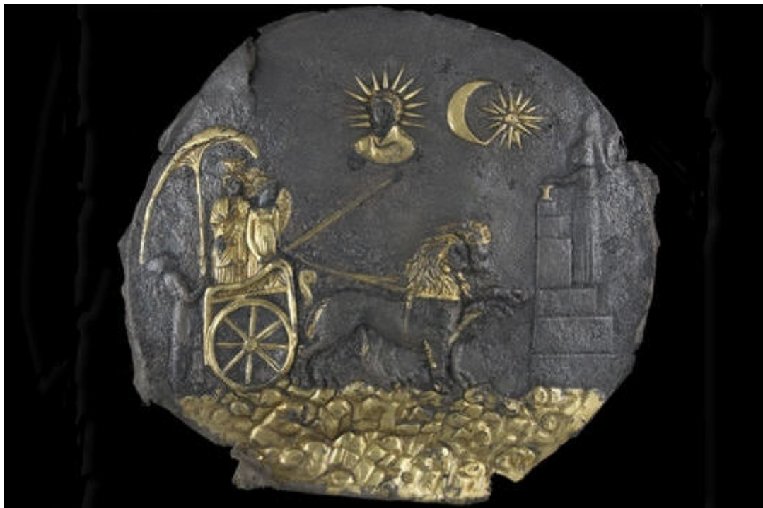
Plaque de Cybèle (Aï Khanoum, sanctuaire du temple à niches indentées, IIIe siècle avant J.C., argent doré).