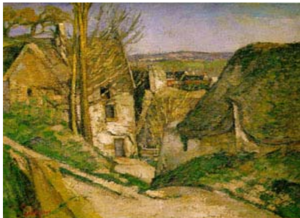
La maison du pendu à Auvers s/Oise